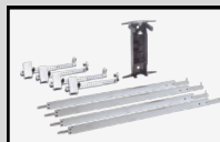
Barra para alinhar carreta